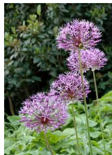
Sierui of Allium aflatuense

Een prettige overwintering en tot seizoen 2010.