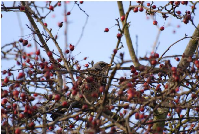
Hulst ( Ilex aquifolium ): lijsters zijn dol op de grote orangjerode bessen.

Hondsroos ( Rosa canina ): is door de dichte structuur zeer in trek bij vogels om er hun nest in te bouwen. De bottels zijn een lekkernij voor lijsters, groenlingen en soms pestvogels.